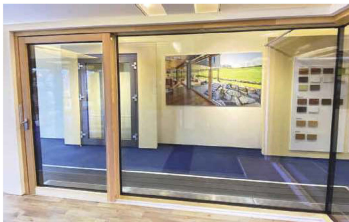
/ Die Hebe-Schiebetür Sky bietet mit schlanken Flügelprofilen, rahmenloser Festverglasung und einer Ganzglasecke eine großzügige freie Aussicht.

Der Fenster- und Türenhersteller Höhbauer stellte bei seinem digitalen Partnertag seine neue Hebe-Schiebetür Sky vor. Der Name Sky verrät schon, was das Besondere an diesem System ist. Mit den schlanken Flügelprofilen und der rahmenlosen Festverglasung mit besonders großen Glasflächen verschmelzen Außen und Innen nahezu. Diese Wirkung wird noch verstärkt, wenn die Hebe-Schiebetüre mit einer Ganzglasecke kombiniert wird.