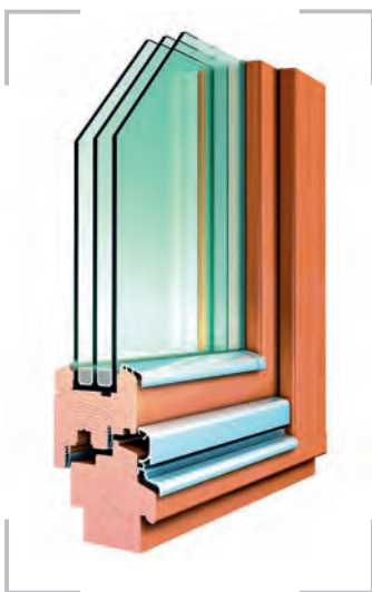
/ Die Fensterserien TimberAlWin 78 (o.) und TimberWin 78 erreichen im Stan-dard einen U_w -Wert von 0,9 \text{ W}/\text{m}^2\text{K} .

Höhbauer GmbH 92706 Luhe-Wildenau www.hoehbauer.com