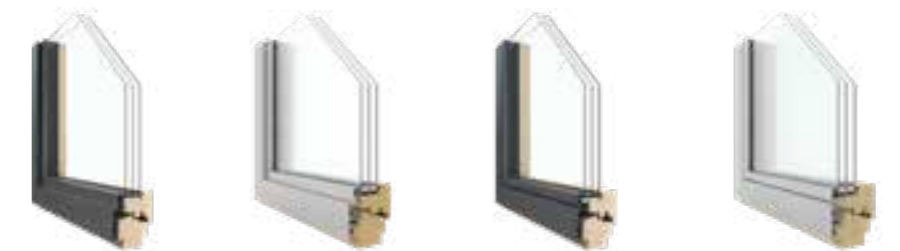
auria Shine 78 auria Shine 88 auria Shine Contura 78 auria Shine Contura 88