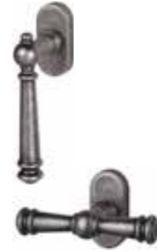
Antik-Iron-Oliven versprühen klassischen Charme und runden sowohl dezent als auch stilsicher das Erscheinungsbild des auria Stil Denkmalschutzfensters ab.