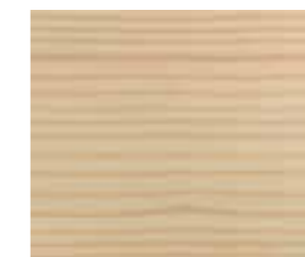
Soft Natur FR 17 (Abb. auf Fichte)