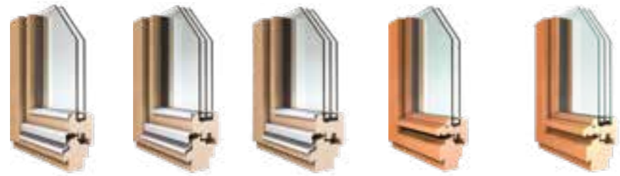
auria 68 auria 78 auria 88 auria Stil 68 auria Stil 78