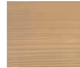
Vita Natur V 20 (Abb. auf Vita Tanne)