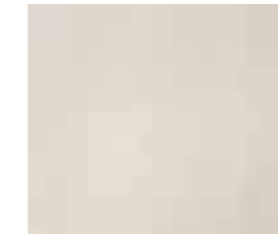
Weiß Deckend FR 15 (Abb. auf Red Grandis)