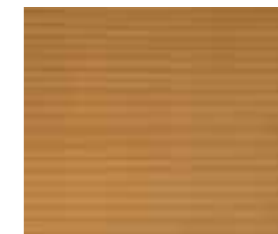
Ligno Natur LV 21 (Abb. auf Vita Tanne)