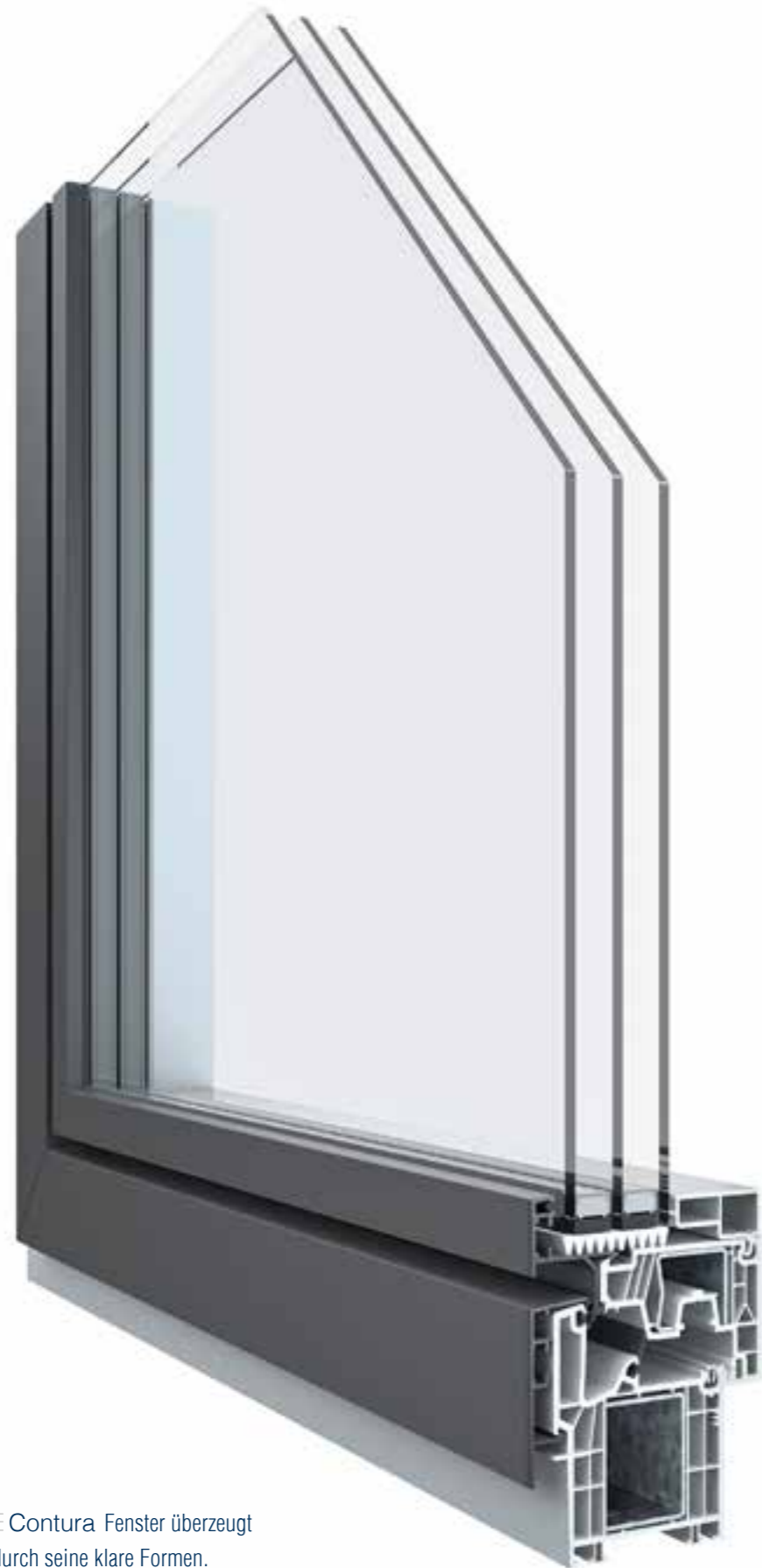
Das Lunea Shine ONE Contura Fenster überzeugt in modernen Bauwerken durch seine klare Formen.